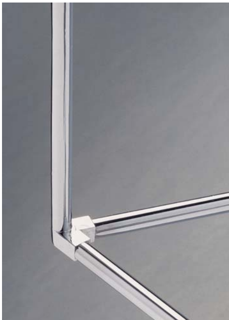
Detalle del pie de la flamingo.