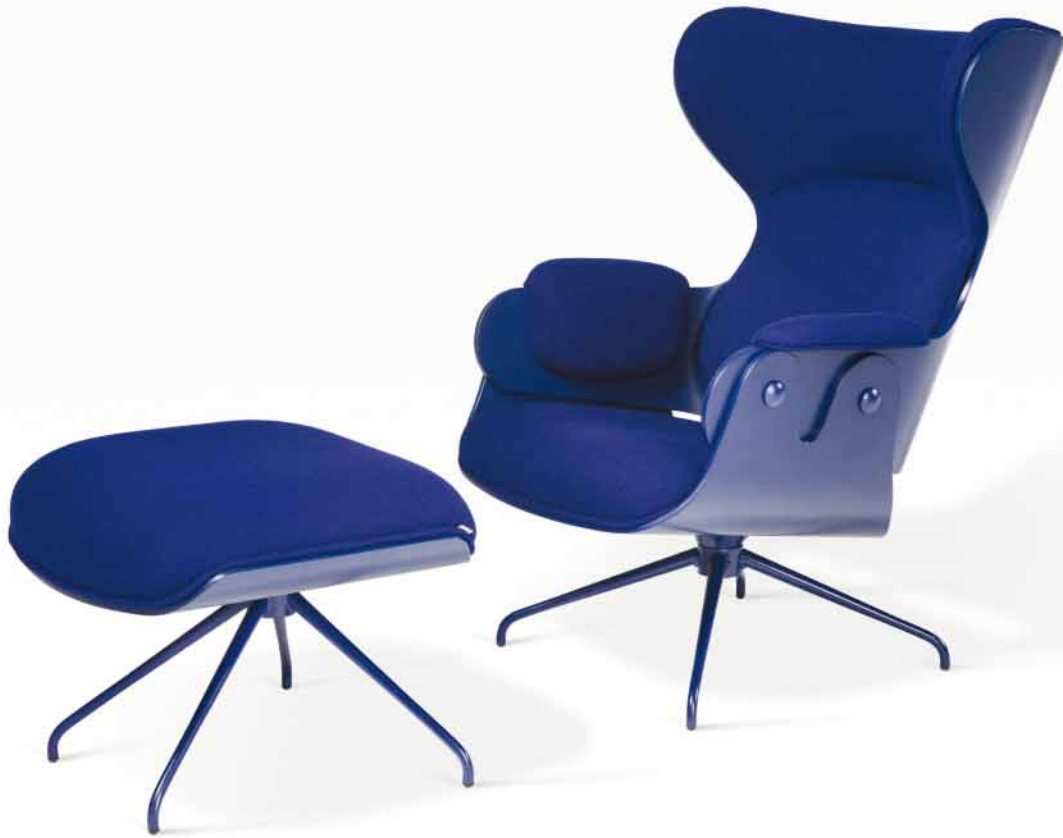
Lounger mit Fußbank.